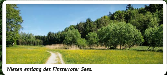
Wiesen entlang des Finsterroter Sees.

2008 wurde der Finsterroter See saniert. Direkt am See befinden sich eine Liegewiese und ein Kinderspielplatz. Für Aktive sind rund um den See Wanderwege und eine Nordic-Walking Strecke angelegt. Tret- und Ruderbootverleih ermöglichen eine schöne Fahrt auf dem Wasser. Für Essen und Trinken sorgt der Kiosk am See. Auch Angeln ist mit gültigem Jahresfischereischein und Tageskarte am Finsterroter See gestattet.