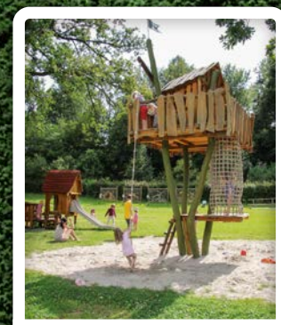
Der Abenteuerspielplatz direkt am See.